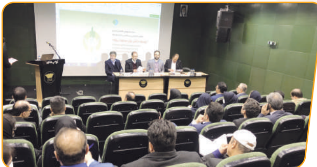
پنل تخصصی توسعه مدیریت دانش بنیان با حضور مدیر عامل بیمه پارسیان

بیمه پارسیان با حضور نایب رییس هیات مدیره و مدیرعامل در پنل تخصصی توسعه مدیریت دانش بنیان در فرآیند های بیمه گری که دارای چندین مقاله در بخش های مختلف توسط همکاران و همچنین برپایی غرفه و معرفی محصولات جدید خود در حوزه تکنولوژی و فناوری در این همایش حضوری فعال داشت. براساس این گزارش در نمایشگاه جانبی همایش بیمه و توسعه غرفه اختصاصی بیمه پارسیان با معرفی نرم افزار های کاربردی بیمه ای که محصول حوزه فناوری شرکت هستند حرکت خود را به سمت استفاده از تکنولوژی نوین و خدمات کاربردی