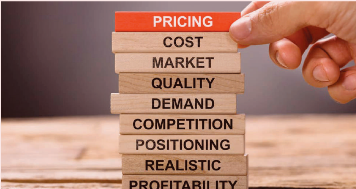
تهیه شده در مدیریت ریسک

اولین گام در نرخ‌گذاری طبقه‌بندی، شناسایی فاکتورهای نرخ‌گذاری برای تقسیم بندی افراد بیمه شده با ریسک‌های مشابه به گروه‌های مختلف می‌باشد. برای مثال یک شرکت جبران غرامت کارگران باید تصمیم بگیرد که ویژگی‌های ریسکی مانند تعداد، سطح مهارت و نوع کارکنان بعنوان فاکتورهای نرخ‌گذاری در نظر گرفته شوند یا خیر؟ معیارهای مختلفی برای ارزیابی مناسب بودن فاکتورهای نرخ‌گذاری وجود دارد که عبارتند از: